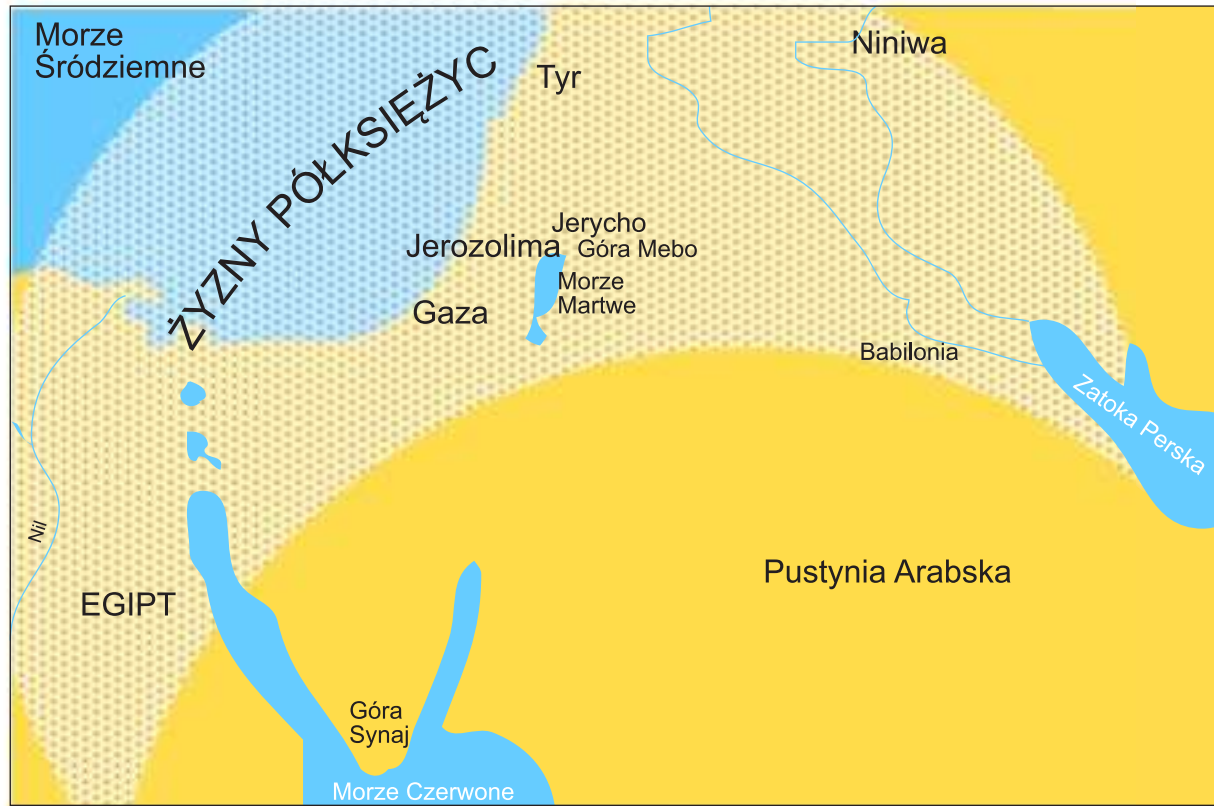
ZIEMIE NA KTÓRYCH POWSTAWAŁA BIBLIA

OKRES FORMOWANIA SIĘ STAREGO I NOWEGO TESTAMENTU